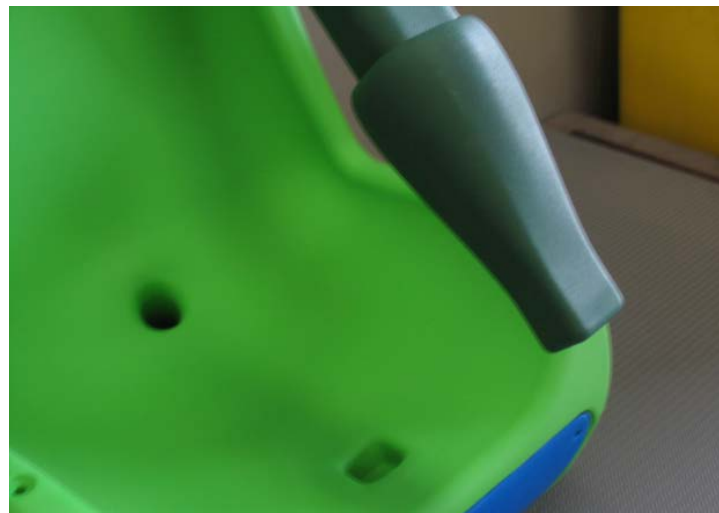
Asiento inclusivo para columpios (incl. cadenas) Inclusive swing's seat (chains included) Siège inclusif de balançoire (incl. chaînes)