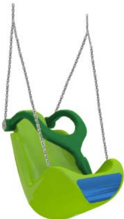
ASIENTO INCLUSIVO PARA COLUMPIOS INCLUSIVE SWING'S SEAT SIÈGE INCLUSIF DE BALANÇOIRE